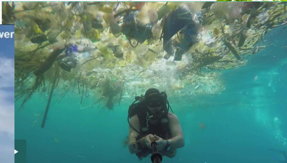
英國潛水者於峇里島海域發現大量塑膠垃圾