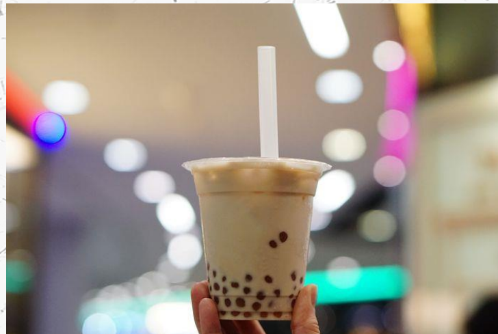
一次用外帶飲料杯